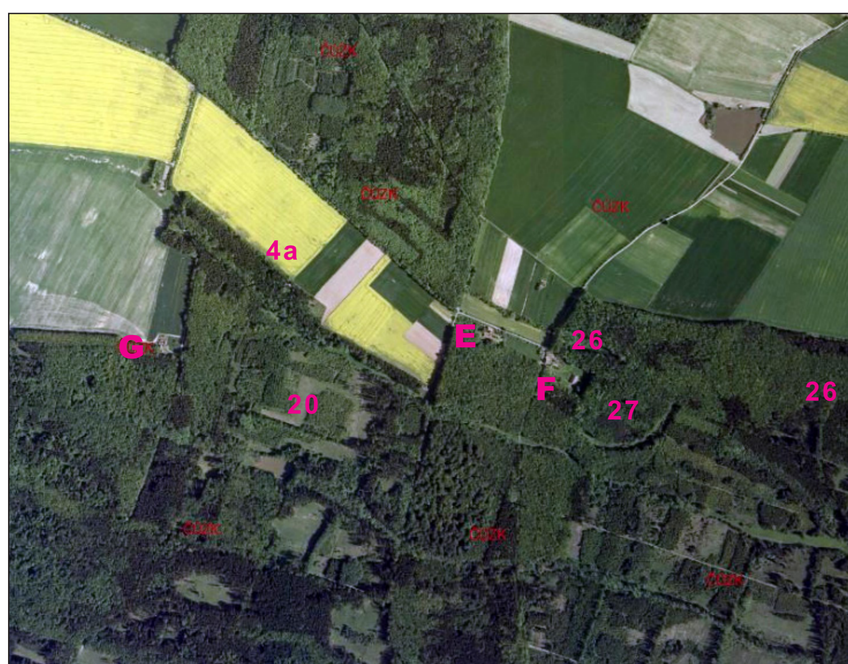
Výřez snímku ORTO FOTO mapy z roku 2004, na kterém kvetoucí řepkové pole výrazně naznačují plochu zrušené části Novosyrovické bažantnice