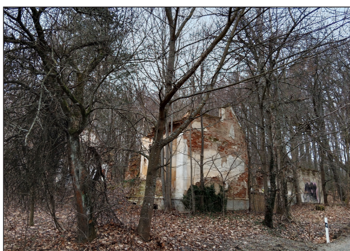
Ruiny zaniklého dvorce Wilhelmienhof