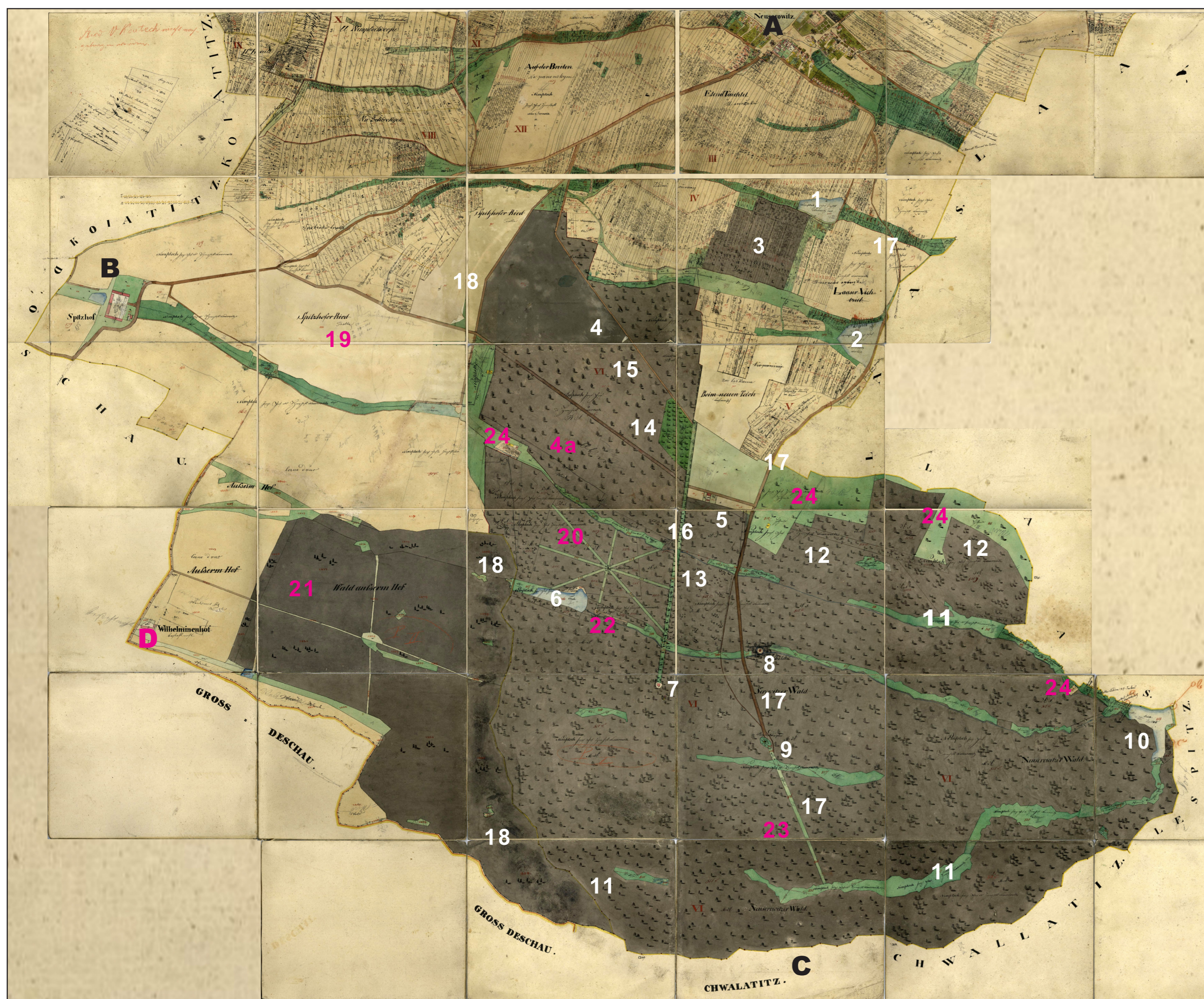
Identifikační skica katastru Nové Syrovice z roku 1866, s poslední úpravou 1946 (v textových popiskách skici jsou počestněny bývalé německy psané místní názvy)

Komponovaná lovecká a rekreační krajina bývalého lesního revíru „NeuSerowitz - Wald“ Část A - Přehled vývoje komponovaných prvků a krajinných struktur - nositelů kulturních funkcí